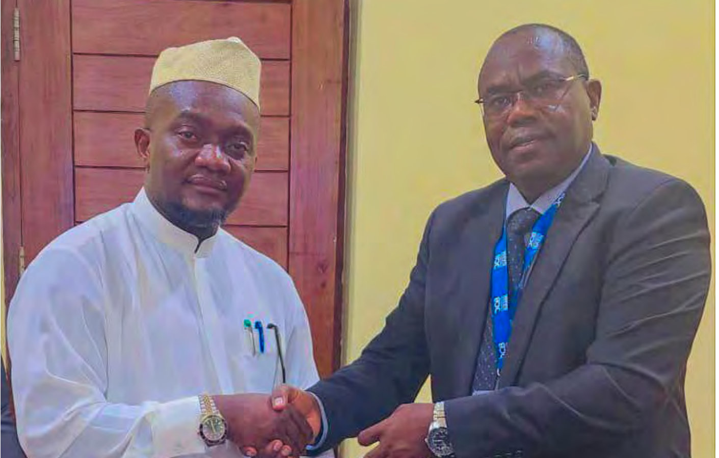
Mkurugenzi Mtendaji wa benki walikutana na Mhe, Mohamed Omary Mchengerwa, Waziri wa Nchi Ofisi ya Rais, TAMISEMI, kujadili mbinu za kibiashara za kushirikisha wananchi katika maendeleo ya taifa letu.