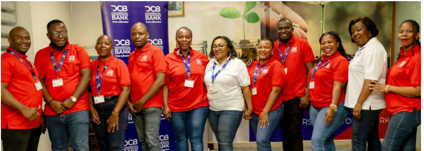
Wafanyakazi wa benki idara ya mikopo ya vikundi (NGUVU MOJA) siku ya kupongezwa kwa kazi nzuri.