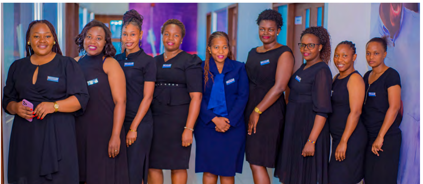
Wafanyakazi wa benki idara ya mikopo ya wajasiriamali wanawake (TAUSI) siku ya kupongezwa kwa kazi nzuri