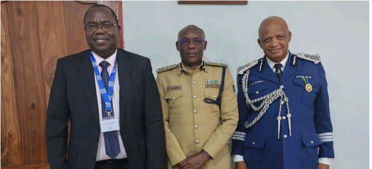
Mkurugenzi Mtendaji wa benki alipotembelea ofisi za Polisi mjini Dodoma na kukutana na Mkuu wa Jeshi la Polisi Tanzania (IGP) Bw. Kamilius Wambura pamoja na CP Leberatus Sabas kujadili fursa mbalimbali zinazopatikana mjini hapo na kuendelea kuimarisha uhusiano mzuri baina ya taasisi hizi mbili.