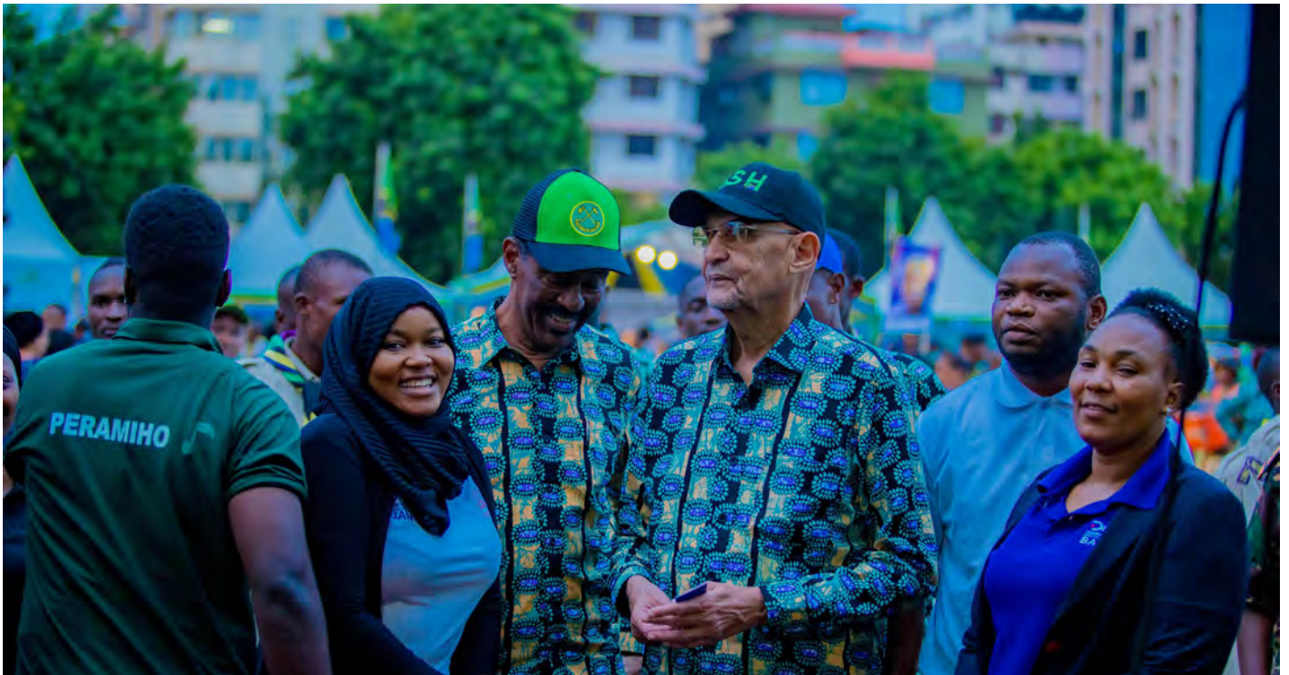
Wafanyakazi wa benki wakiwa pamoja na Naibu Spika wa Bunge la Jamhuri ya Muungano wa Tanzania na Mbunge wa jimbo la Ilala Mhe. Mussa Azzan Zungu katika kongamano la vijana wa jiji la Dar es Salaam lililofanyika katika viwanja vya Mnazi Mmoja ambapo pia kongamano hilo liliambatana na zoezi la kupokea mwenge wa uhuru katika wilaya ya Ilala.