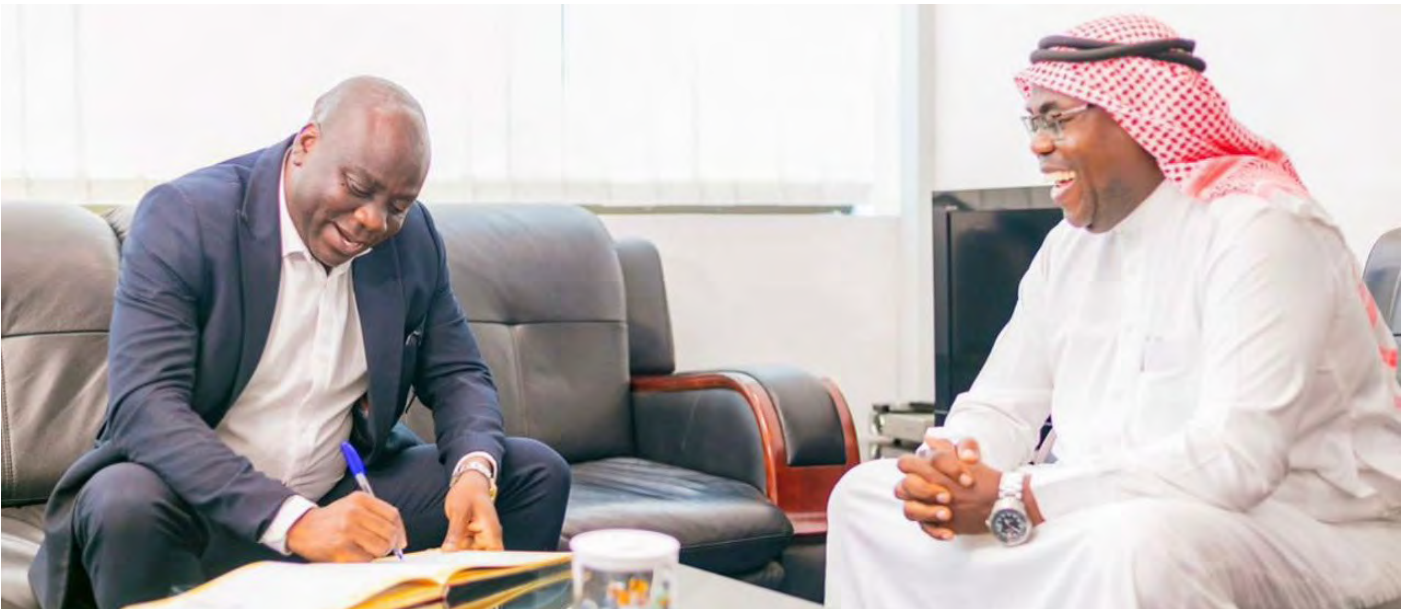
Mkurugenzi Mtendaji wa benki akiwa na Mstahiki Meya wa jiji la Dar es Salaam Mhe. Omary Kumbilamoto katika jitihada za kuimalisha ushirikiano na halimashauri za jiji la Dar es Salaam na kuhusu fursa za pamoja.